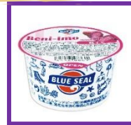
紅芋 Purple-Sweet Potato