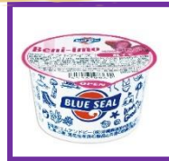
紅芋 Papel-Sweet Potato